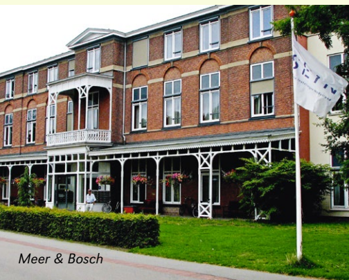
Meer & Bosch

Fonteinkruid is een kleinschalige woonvoorziening middenin de Zwolse wijk Stadshagen. De ligging draagt eraan bij dat de cliënten kunnen integreren in de wijk. Fonteinkruid is een modern gebouw met woonruimtes die geheel zijn aangepast aan cliënten met epilepsie van alle leeftijden, al dan niet met een verstandelijke en/of lichamelijke beperking. Op de begane grond bevinden zich spreek- en behandelkamers en ruimtes voor dagbesteding. Cliënten kunnen genieten van een mooie binnentuin waar een beleefstuin voor hen is gecreëerd.